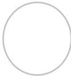
สีขาว จริยศึกษา