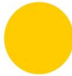
สีเหลือง พุทธศึกษา