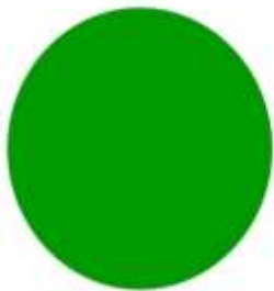
สีเขียว พลศึกษา